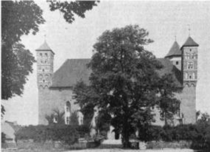
Heilsberg: Das Alte Schloss

zielstrebig und schließlich mit Erfolg taten und das natürliche Zusammenwachsen zumindest um viele Jahre beschleunigten.